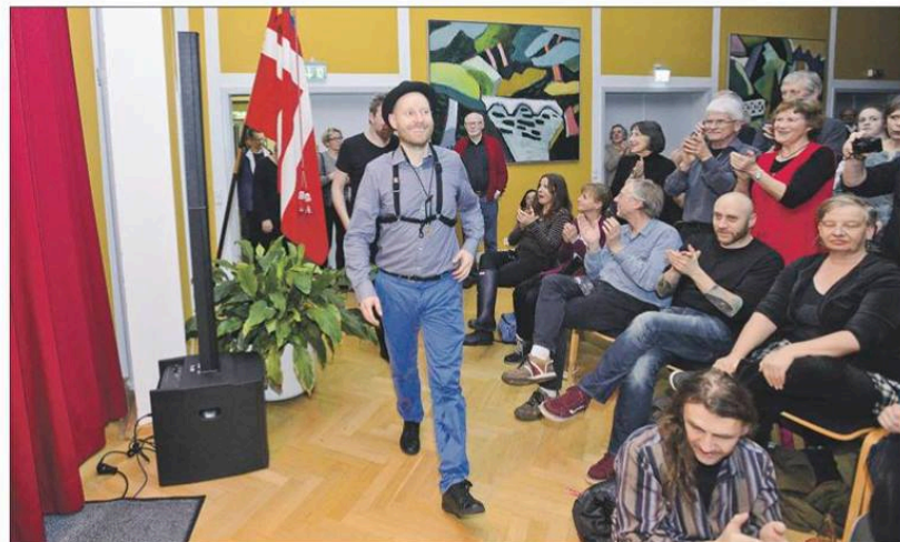
Tilbage til ekstranummer efter et bragende bifald i det propfyldte Flensborghus.